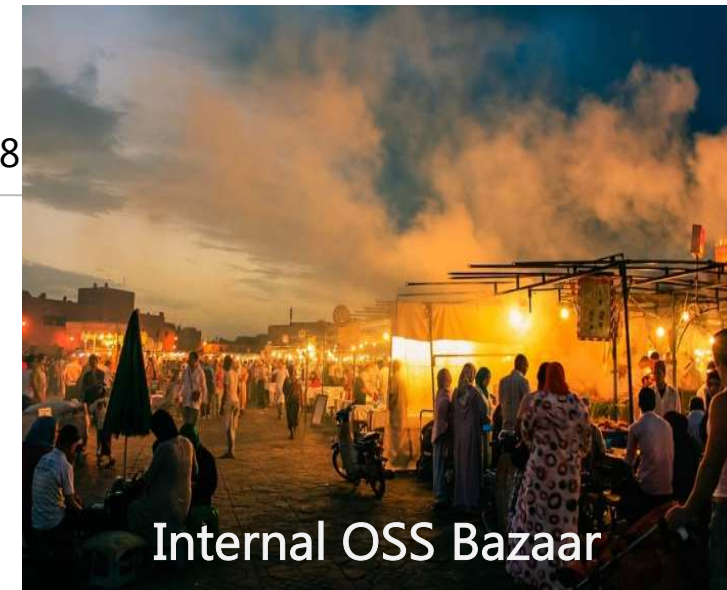
Internal OSS Bazaar