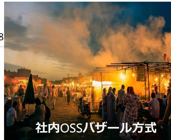
社内OSSバザール方式